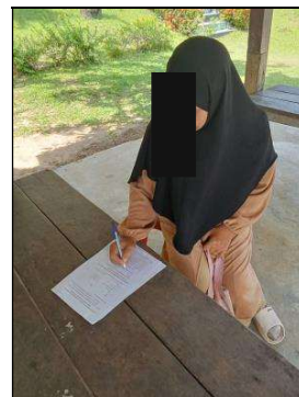
รูปภาพที่ 1 (ต่อ) การลงพื้นที่สำรวจข้อมูล