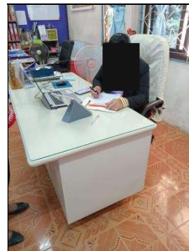
รูปภาพที่ 1 (ต่อ) การลงพื้นที่สำรวจข้อมูล