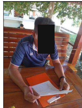
รูปภาพที่ 1 (ต่อ) การลงพื้นที่สำรวจข้อมูล